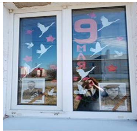
страничку подготовила Тамара Клинк

Совет ветеранов и клуб активного долголетия «Любава» ежегодно принимают участие в акции. Своим участием в акции мы отдаем дань памяти подвигу и доблести героев Великой Отечественной войны. Тем самым мы выражаем благодарность всем тем, кто подарил нам мирное небо.