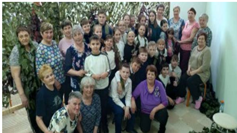
Учащиеся 4 класса МАОУ Горьковская СОШ и «серебряные» волонтеры

В нашей газете «Любава» мы уже освещали, как «серебряные» волонтеры вносят свою лепту в помощь нашим бойцам, участвующим в СВО, они плетут маскировочные сети для укрытия военной техники и блиндажей. Для военных "за ленточкой" маскировочная сетка — что бронезилет и бомбоубежище, но при этом и расходный материал, который в условиях боевых действий быстро приходит в негодность. Потребность в маскировочных сетках очень высока. 28 апреля ребята 4 класса, МАОУ Горьковской СОШ приняли активное участие в таком важном деле. Плетение маскировочной сетки дело кропотливое, в каждую её ячейку вплетается доброта и любовь, поэтому такая защита надёжней любой брони.